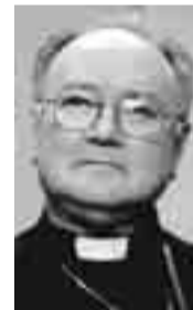
Il cardinale Renato Martino, presidente del Pontificio consiglio per la Giustizia e per la Pace, organizzatore del seminario che si è concluso lo scorso 27 aprile in Vaticano.

natura che perdono di vista l'uomo». «La natura è per l'uomo e l'uomo è per Dio», ha sottolineato il Presidente del Pontificio Consiglio.